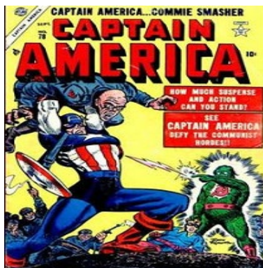
Figura 2 - Capitão América: Esmagador de “Comunas”

Fonte: Captain America nº 78, de setembro de 1954. Disponível em: https://www.marvel.com/comics/issue/23244/captain_america_comics_1941_78