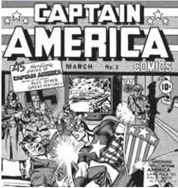
Figura 1 – Questão aplicada no ENEM em 2012

Com sua entrada no universo dos gibis, o Capitão chegaria para apaziguar a agonia, o autoritarismo militar e combater a tirania. Claro que, em tempos de guerra, um gibi de um herói com uma bandeira americana no peito aplicando um sopapo no Fûrer só poderia ganhar destaque, e o sucesso não demoraria muito a chegar.