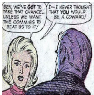
Figura 3 - Susan Storm tentando convencer Ben Grimm a embarcar uma missão espacial para vencer os “comunas”